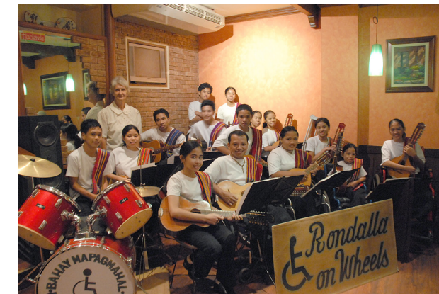
Concert dans un restaurant à Manille pour les visiteurs belges

Après leur séjour au « Foyer aimant », les musiciens diplômés pouvaient rester membres du groupe « Rondalla on Wheels ». Ils devaient alors s'engager à participer régulièrement aux répétitions. Ils devenaient des « seniors », tandis que les enfants du foyer étaient baptisés « juniors ». Les deux groupes se sont exercés et se sont produits ensemble pendant plusieurs années.