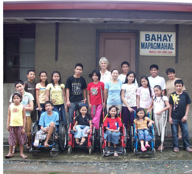
Les enfants de Bahay Mapagmahal (« Foyer Aimant »)

Mais mon amour s'est également étendu à une vingtaine d'enfants qui séjournent au « Foyer aimant » ou « Bahay Mapagmahal » en tagalog. J'ai été leur éducatrice et leur accompagnatrice. « Foyer aimant » est une initiative privée, qui offre un foyer temporaire à des enfants et des jeunes handicapés en pleine croissance et en âge scolaire. Le Foyer est situé dans le domaine du centre orthopédique philippin à Manille. Les jeunes viennent de tous les coins du pays, de familles très pauvres ou de bidonvilles où il leur est impossible d'aller à l'école.